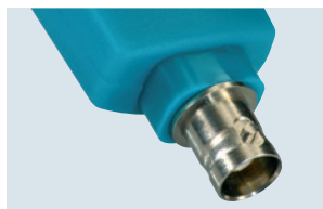
testo 206-pH3: pH3-Sondenkopf mit BNC-Schnittstelle