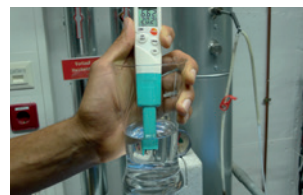
Ideal geeignet zur Überprüfung von Heizungswasser gemäß VDI 2035.